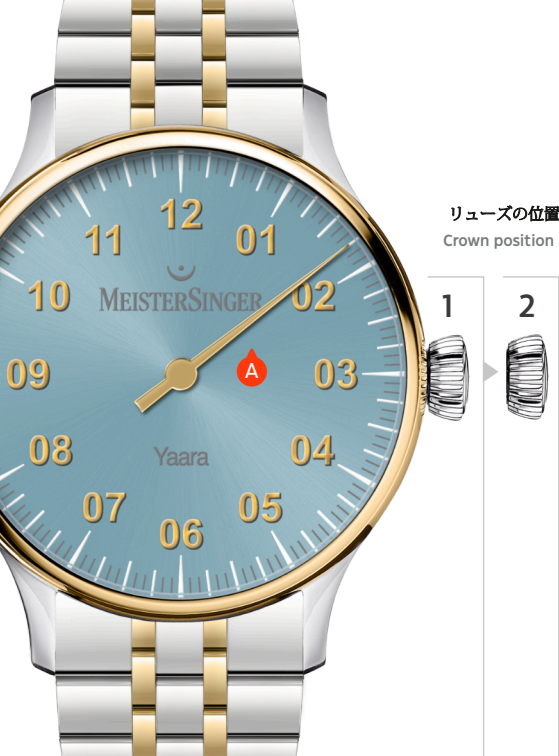
リューズの位置 Crown position